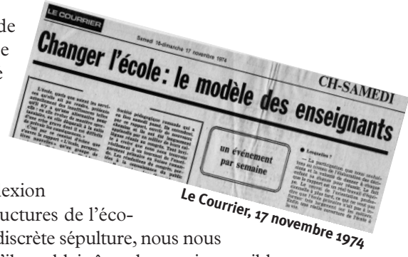
Le Courrier, 17 novembre 1974