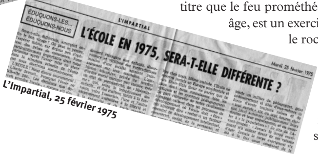
L'Impartial, 25 février 1975

Les enseignants de Suisse romande n'ont pas oublié les péripéties de l'enterrement d'un rapport dénommé peu poétiquement «rapport du GROS» (Groupe de réflexion sur les objectifs et les structures de l'école). A l'occasion de cette discrète sépulture, nous nous étions permis de dire qu'il semblait être devenu impossible, en Suisse romande, de fonder l'acte d'enseigner sur une philosophie, puisque ceux qui, en vertu des pouvoirs qui leur ont été conférés, détiennent la responsabilité de l'école, avaient décidé d'ajourner un débat dont le caractère fondamental n'avait échappé à personne. (...) Nous avons intitulé notre texte «le Mythe de Sisyphe»; en effet, si nous croyons qu'une réflexion philosophique sur les objectifs est indispensable, nous sommes bien d'accord qu'elle n'aura jamais de fin, qu'elle est bien, à proprement parler, le rocher de Sisyphe. Cependant, ce rocher de Sisyphe nous paraît inhérent à la nature humaine, au même titre que le feu prométhéen. Remuer ce rocher, en un effort qui se répète d'âge en âge, est un exercice qui, seul, nous rend dignes d'être. Le rapport 1974, c'est le rocher de Sisyphe. (...)