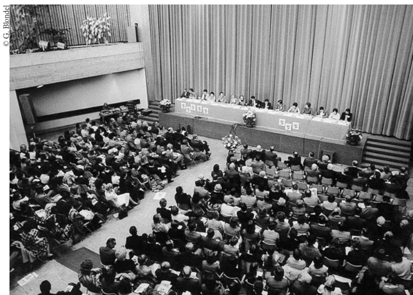
Thônex, 8 novembre 1974

des conclusions (qui auraient encore une grande valeur aujourd'hui), les mêmes responsables refusaient le rapport du GROS, et l'enterraient discrètement. Ce rapport n'eut aucune suite et personne ne se risqua à faire une nouvelle tentative. Plus de mille collègues de toute la Suisse romande se sont retrouvés donc les 8 et 9 novembre 1974 pour demander avec une belle unanimité une politique éducative nouvelle, un renouveau de l'école «par des réformes fondamentales qui doivent être entreprises sans tarder», la réduction des effectifs des classes, la limitation de la grandeur des bâtiments scolaires et pour «inviter la population et les pouvoirs publics à placer l'éducation au premier plan de leurs préoccupations et à ouvrir un débat approfondi à son sujet».