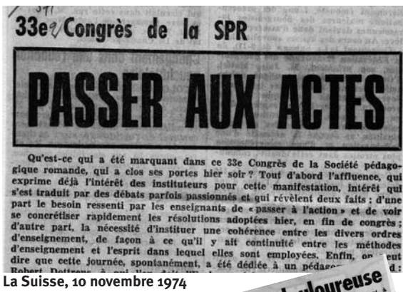
La Suisse, 10 novembre 1974