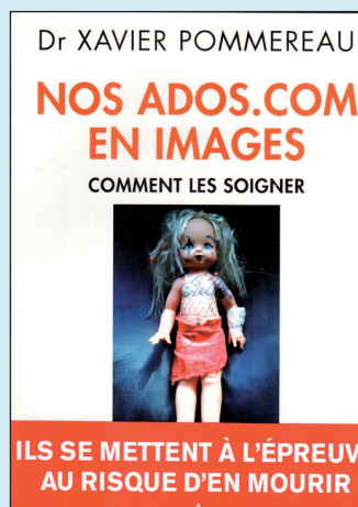
Dr. Xavier Pommereau. (2011). Nos ados.com en images. Comment les soigner. Paris: Odile Jacob.

La «valeur travail» est ébranlée. Source d'accomplissement personnel, d'estime de soi et de reconnaissance sociale, le travail est de plus en plus vécu comme angoisse de n'être jamais «à la hauteur». L'auteur, sociologue clinicien, explore ce phénomène et montre comment un système managérial, pensé au service exclusif de la performance, est en train de transformer le rapport au travail. En décryptant l'interaction entre le psychique, le social, l'économique, la fragilité singulière des individus est vite blanchie. Elle est effet, et non cause du système. La colère des travailleurs, analysée dans ses sources, se révèle protection d'eux-mêmes. Le diagnostic débouche sur les conditions d'un «travailler mieux, pour vivre mieux». Entre colère et dépression, d'autres voies existent. Mais résister, exprimer et manifester la colère contre tout système inhumain est d'abord la plus raisonnable des réactions.