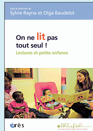
Sylvie Rayna et Olga Baudelot (dir). (2011). On ne lit pas tout seul! Lectures et petite enfance . Paris: erès.

«La médiation est plutôt un art dur qu'une science douce», écrit l'auteur. Par rapport aux nombreux livres traitant d'elle, du conflit et de la négociation, celui-ci présente un apport original: l'arène authentique du médiateur. Un concept qui montre que la médiation n'est pas un processus isolé, mais l'action d'une personne qui s'inscrit dans un lieu et qui a un impact sur la société. L'auteur, universitaire et médiateur, a fondé un Centre de gestion des conflits et de médiation aux Etats-Unis. Pédagogue remarquable, il a formé des centaines de médiateurs dans de nombreux pays. C'est son propre modèle détaillé qu'il présente ici. Les paradoxes, les métaphores et les cas exposés éclairent cette activité complexe qu'il exerce. Fiutak, pour être efficace, réfléchit à son éthique, à son rôle, connaît ses réactions personnelles face au conflit et au pouvoir. Une arène à découvrir.