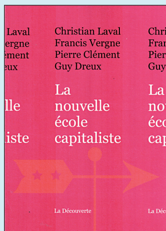
Christian Laval, Francis Vergne, Pierre Clément, Guy Dreux. (2011). La nouvelle école capitaliste . Paris: La Découverte.

L'école capitaliste envahit le monde. Dans ce modèle, elle ne prétend plus dispenser des savoirs gratuits. Sommée de se rendre utile, elle se refuse à engager les élèves dans le pari de la culture et de connaissances qui pourraient se révéler non «payantes». Les auteurs brossent une analyse qui fait froid dans le dos, tant on se sent tous faire partie du problème: cette mutation des systèmes éducatifs ne relève pas d'explications mécanistes, l'école n'est pas la victime passive des méchants capitalistes qui l'encerclent et veulent se l'approprier. Les responsables politiques, l'administration, les groupes professionnels, les parents d'élèves, les étudiants sont autant d'acteurs qui interviennent par leurs conduites dans ces transformations. Ce livre de combat renouvelle la sociologie critique de l'éducation et nous donne des outils d'analyse. Pour résister et construire une alternative résolue.