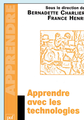
Bernadette Charlier et France Henri. (Dir.). (2010). Apprendre avec les technologies . Paris: Puf.

«Partout s'ébauche devant moi l'image d'une société qui décourage parfois l'enfance, déstructure souvent l'adolescent et entérine sans pitié les inégalités.» C'est d'abord pour ces enfants blessés, ces jeunes humiliés, parfois objets d'un hasard malheureux, que l'auteure a proposé des ateliers théâtre. Pour qu'ils inventent, dans un espace sécurisant, un nouveau langage, une autre image d'eux-mêmes. C'est en théoricienne de sa pratique que la spécialiste précise sa démarche comme étant «ni art-thérapie ni Molière», mais une (re)mise en «JE». Elle présente clairement le déroulement des activités qu'elle propose. Les outils décrits finissent par concerner tous les publics. On s'imagine très vite les utiliser dans nos écoles et collèges, en formation des maîtres, en camps pour développer le lien social, la créativité, la création et la culture. Les publics mixtes décuplant les effets des ateliers.